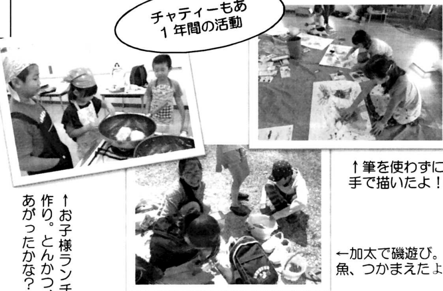
↑筆を使わずに手で描いたよ!