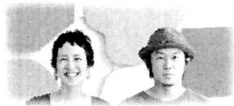
tuperatupera (ツペラツペラ) さんプロフィール